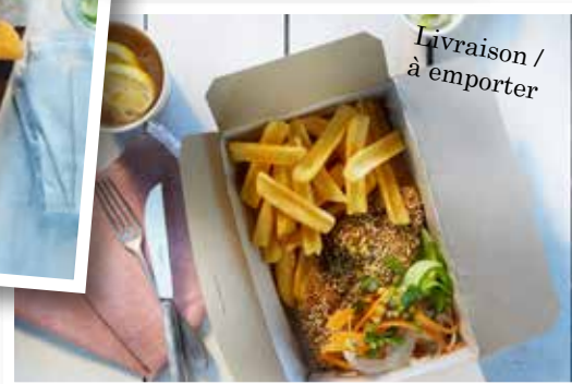
Livraison / à emporter