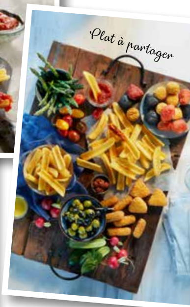
Plat à partager